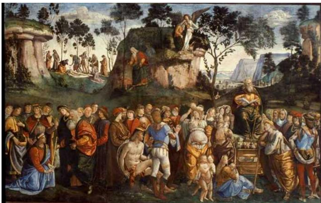
Pietro Perugino, voltooid door Luca Signorelli

(psalm 66:1 'Laat het schallen voor God, heel de aarde!')